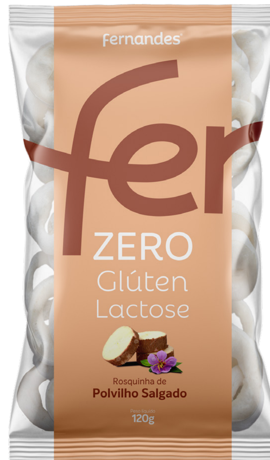
Rosquinha de Polvilho Salgado