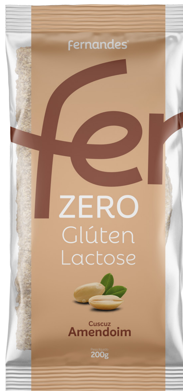
Cuscuz de Amendoim