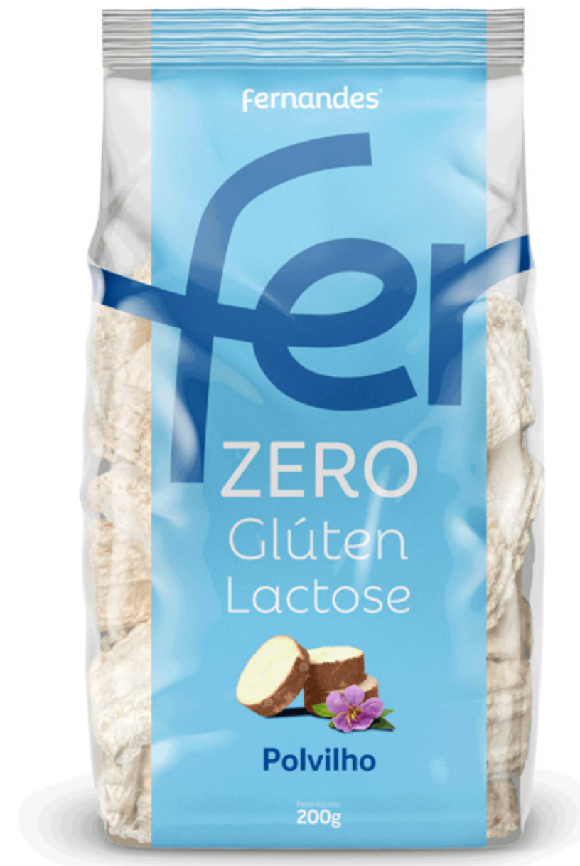
Biscoito de Polvilho