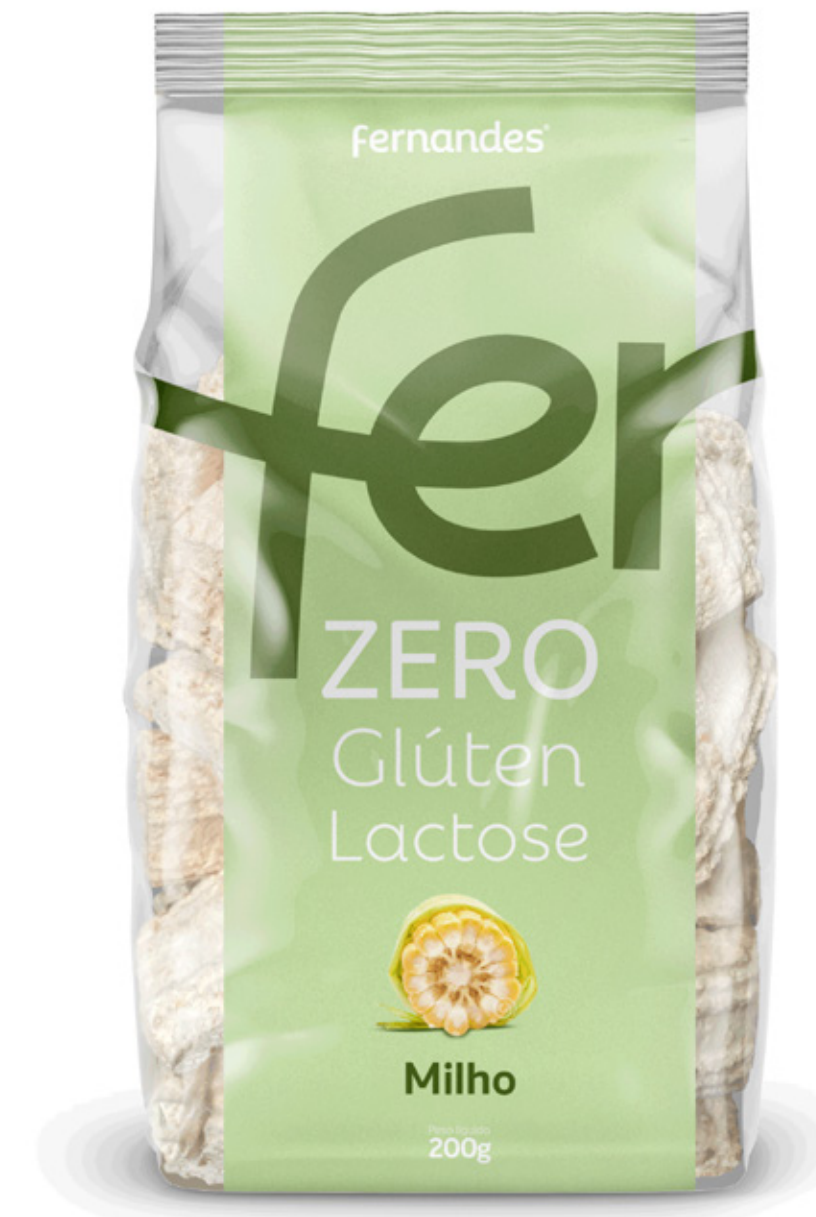
Biscoito de Milho