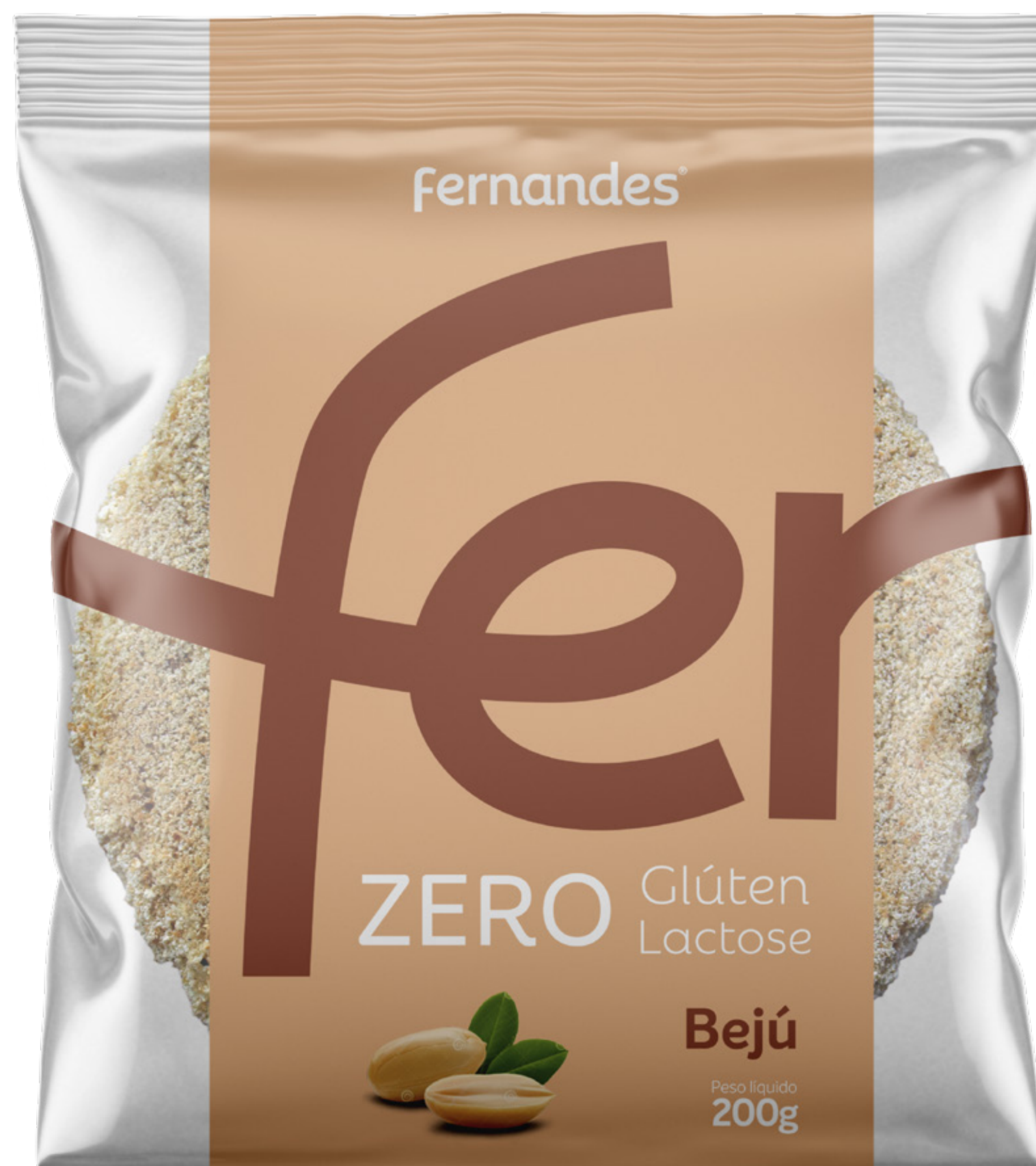
Bejú de Amendoim