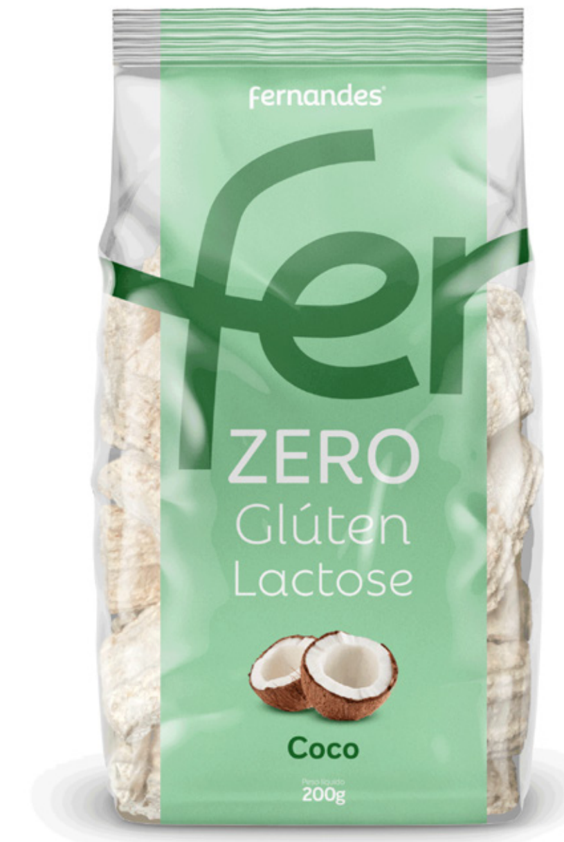
Biscoito de Coco