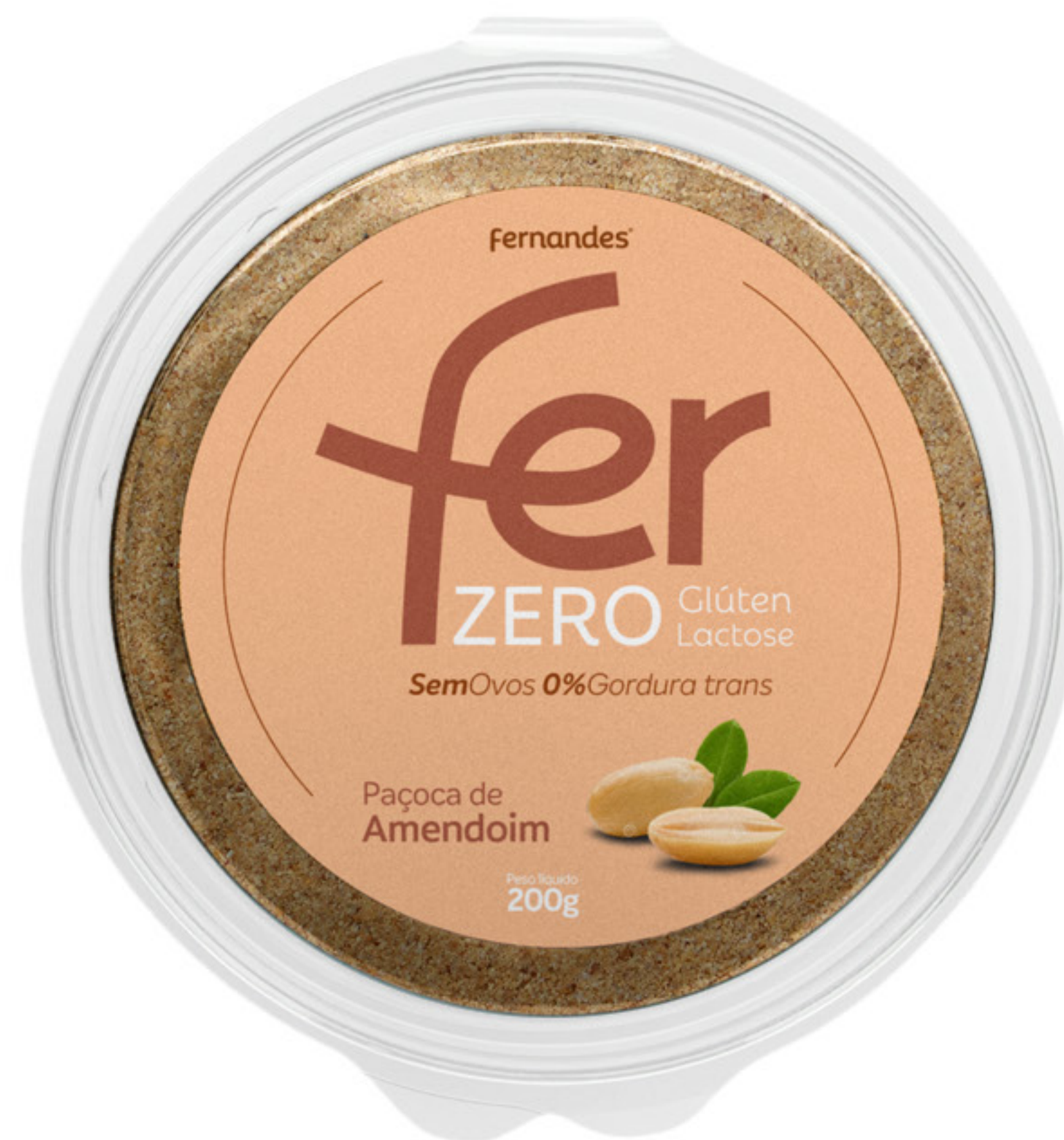
Paçoca de Amendoim