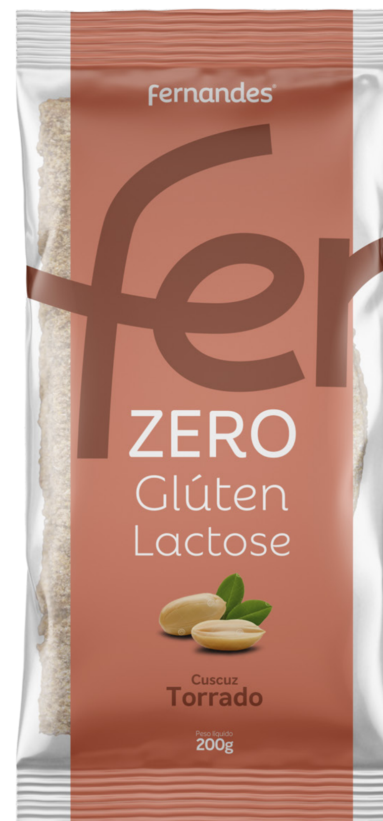
Cuscuz Torrado de Amendoim