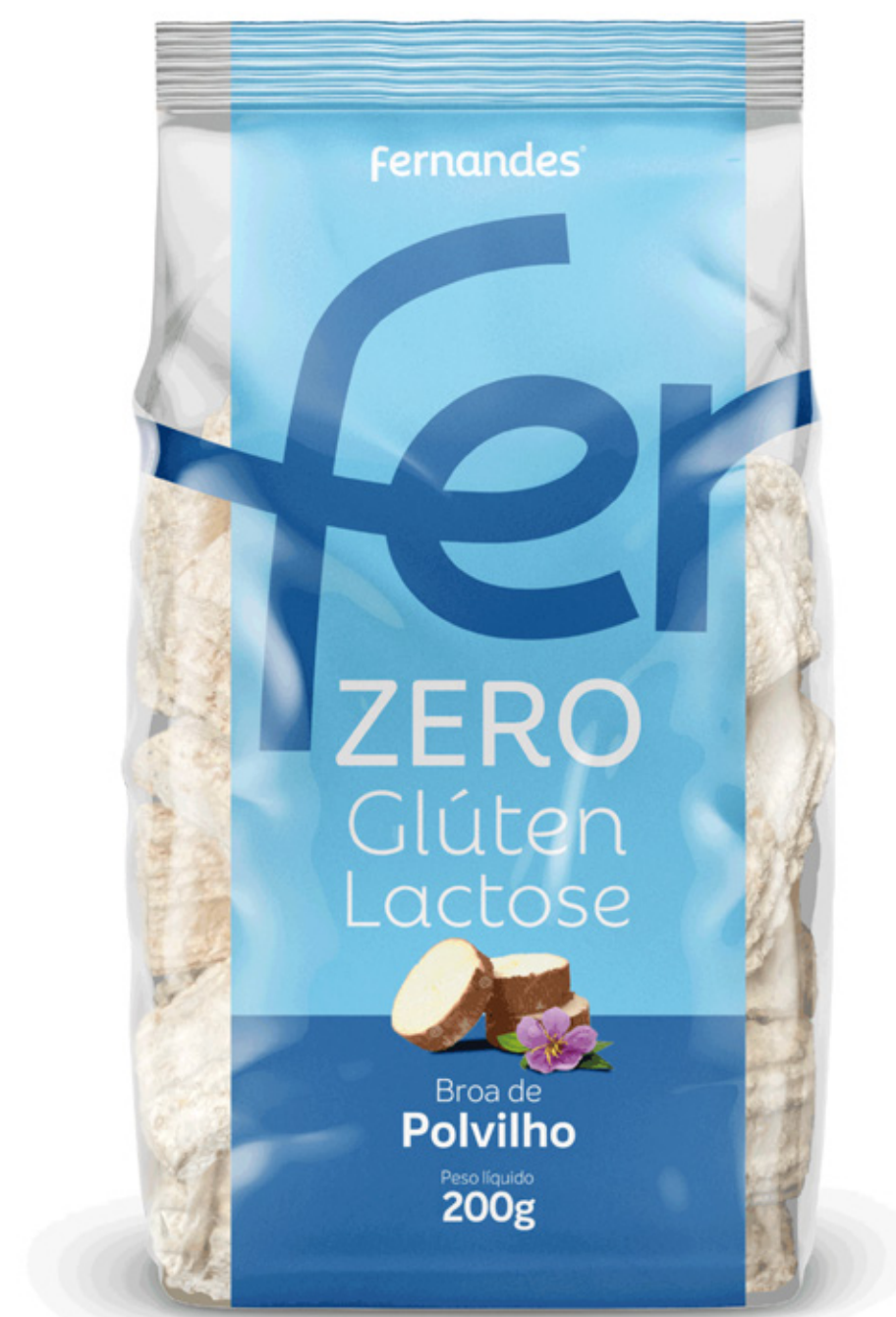
Broa de Polvilho