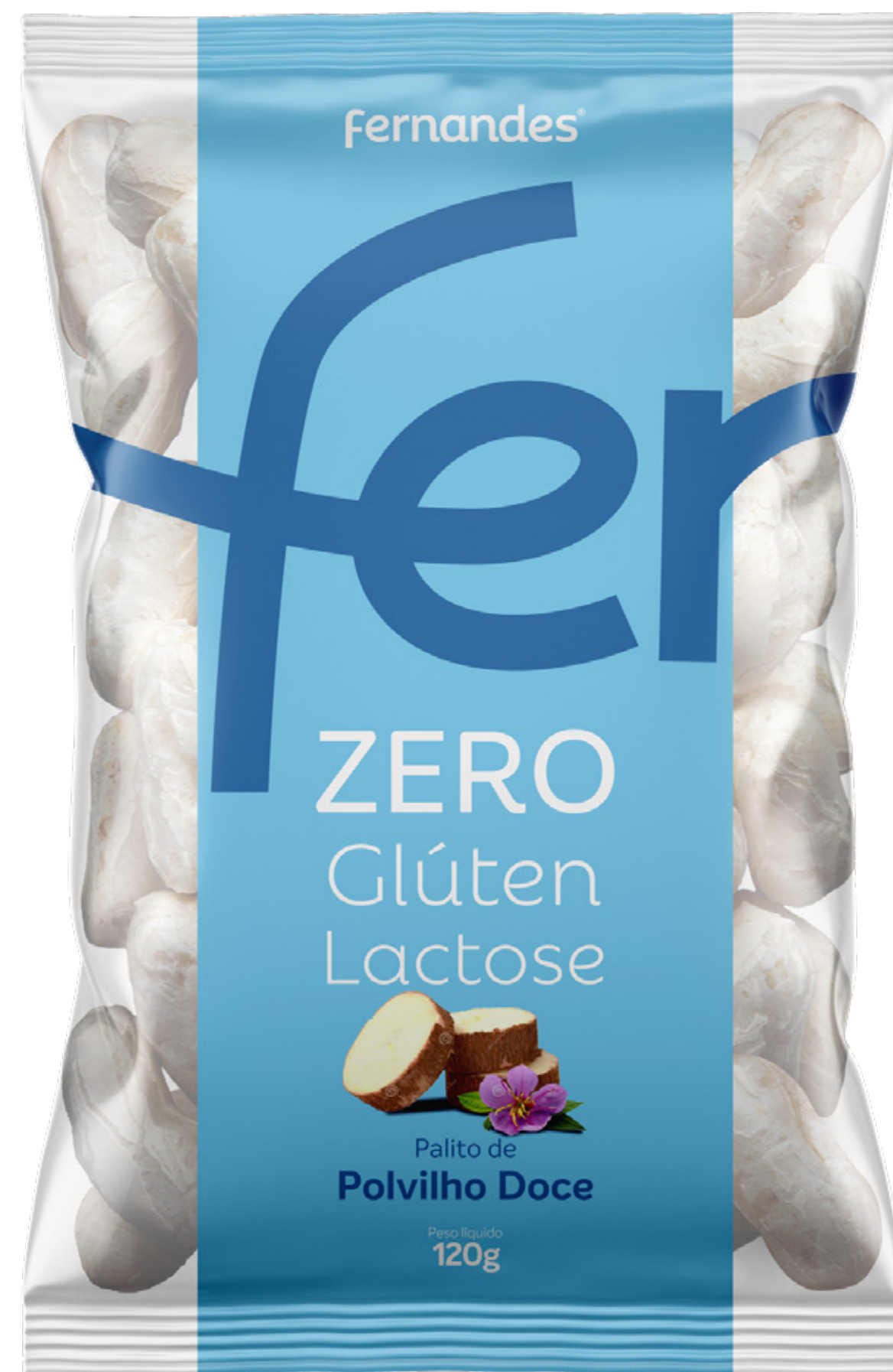
Palito de Polvilho Doce