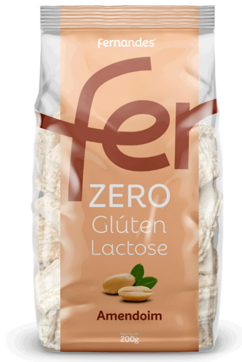
Biscoito de Amendoim