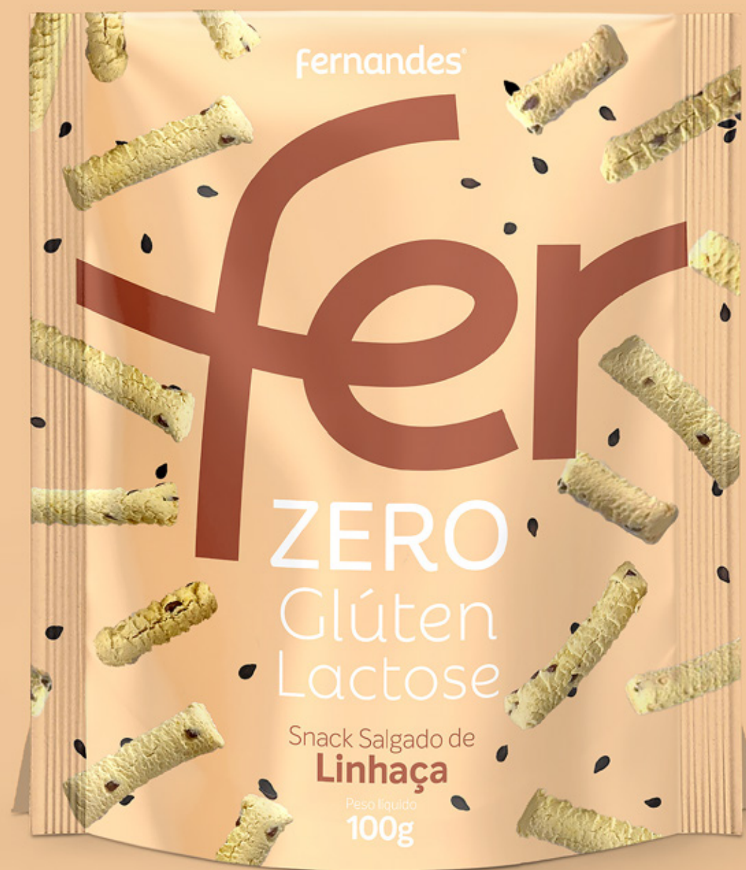
Snack Salgado de Linhaça