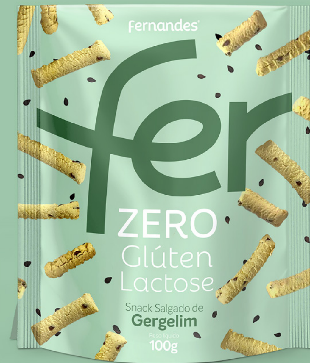
Snack Salgado de Gergelim