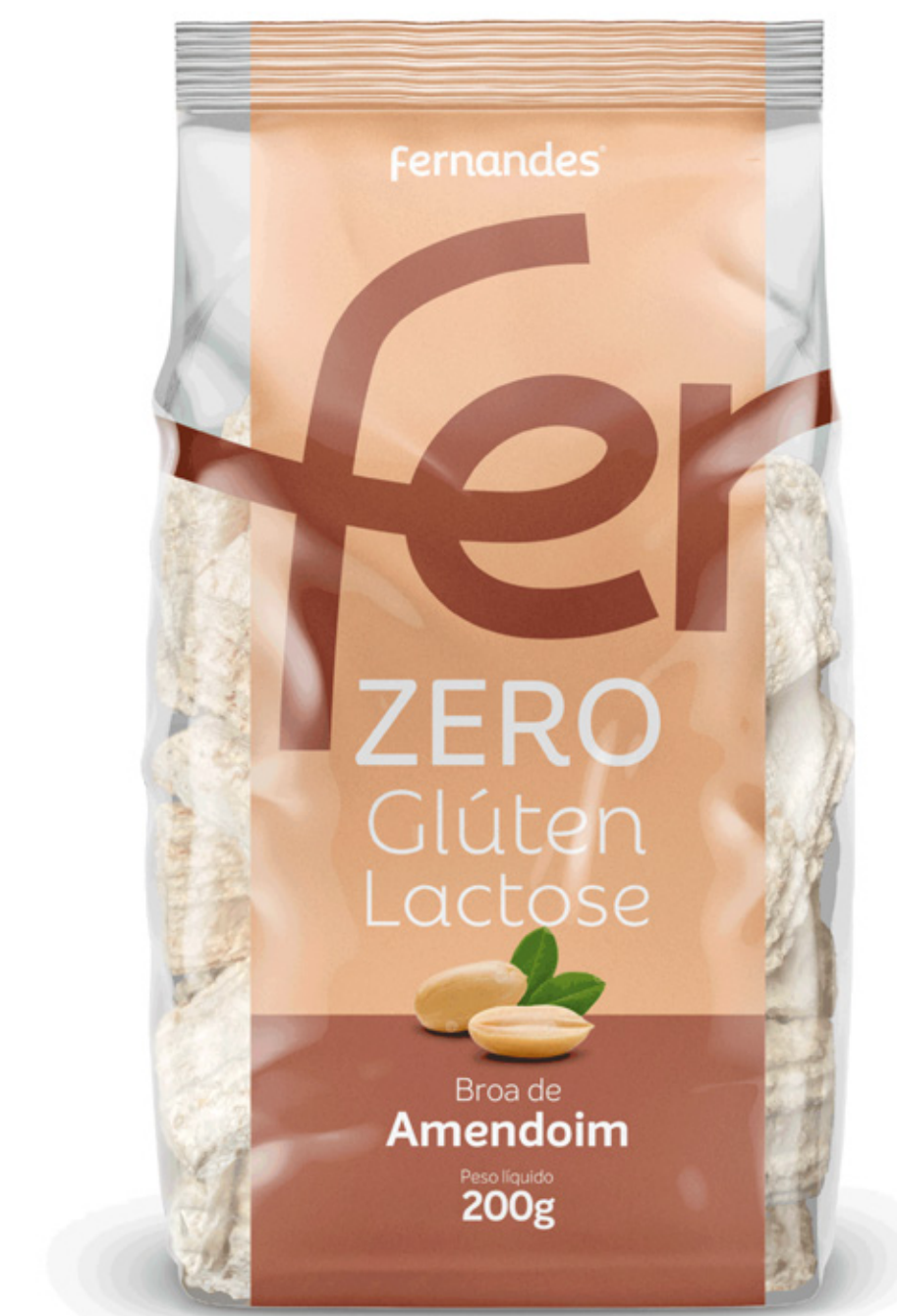
Broa de Amendoim