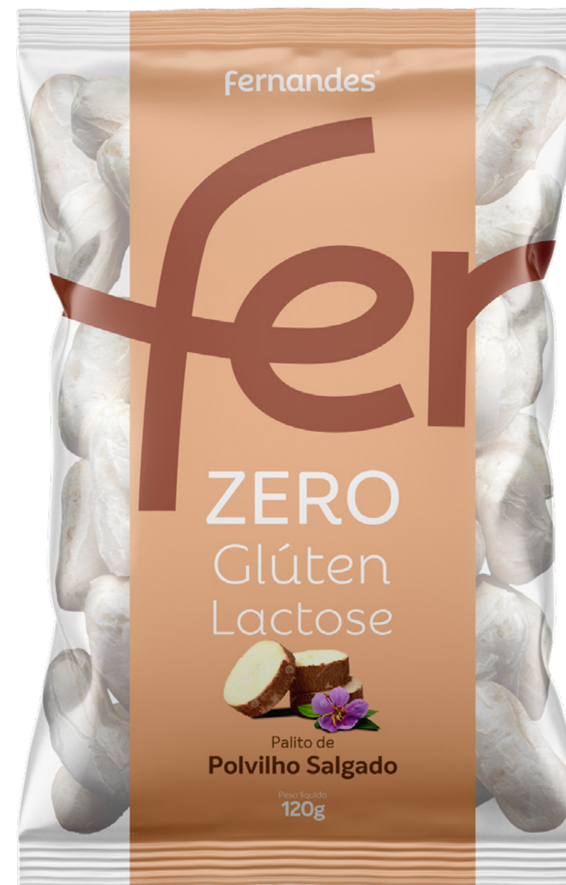
Palito de Polvilho Salgado