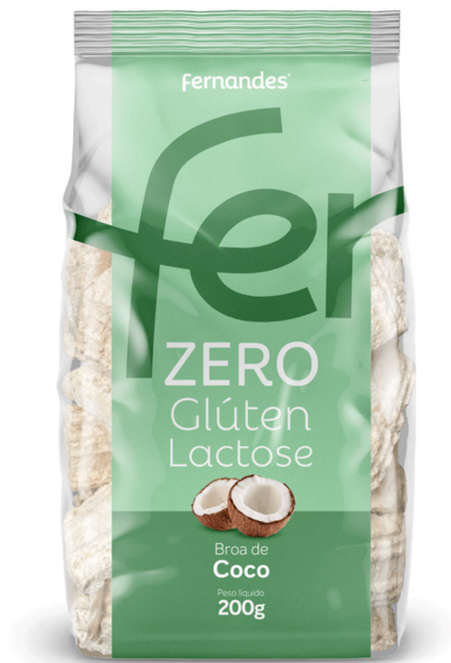
Broa de Coco