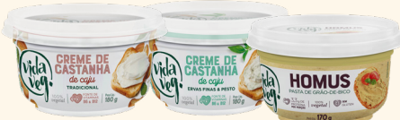
Creme de Castanha 180g e Homus 170g