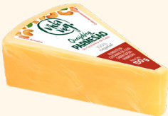
Queijo Parmesão 150g