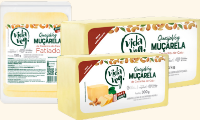
Muçarela em Barra 300g/2kg e Fatiada 150g