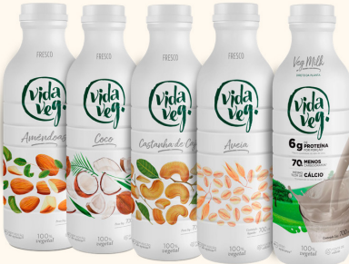
Leite Fresco 700ml