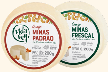
Queijo Minas Padrão e Minas Frescal 200g