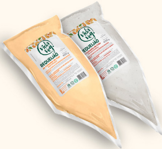
RequeVeg Bisnaga 400g