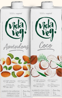
Leite UHT 1L