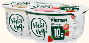
VegProtein (Pote) 160g